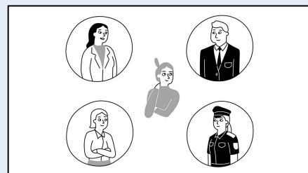
Trainings-Video (12 Minuten)